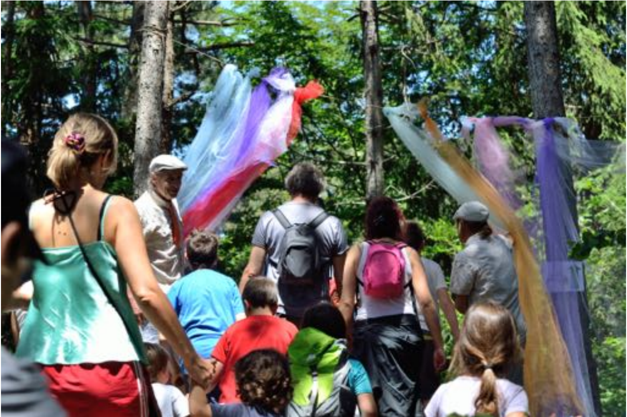
Una bella immagine da Il Cucchiaino dell'Argentario 2014

Anche nel 2014 l'Ecomuseo Argentario ha supportato l' Argentario Day , giornata ecologica promossa dalla Circoscrizione Argentario, collaborando al concorso "Il tuo cartoncino per l'Argentario Day", che premiava i disegni realizzati dai ragazzi delle scuole locali sul tema della tutela e del rispetto dell'ambiente. Sono stati donati degli zainetti per i vincitori e il Direttore-referente operativo dell'Ecomuseo è stato parte della giuria premiante che ha selezionato i 50 disegni più significativi.