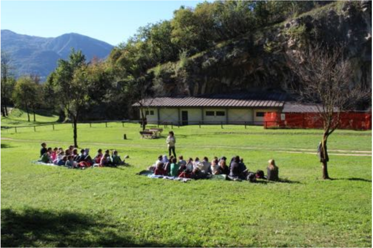
La lettura del racconto "La magia del flauto" al Riparo Gaban con la scuola di Martignano

degli Studi di Trento, il MUSE (editore dei volumi), il Museo delle Palafitte del Lago di Ledro, il Parco Naturale Paneveggio e Pale di San Martino.