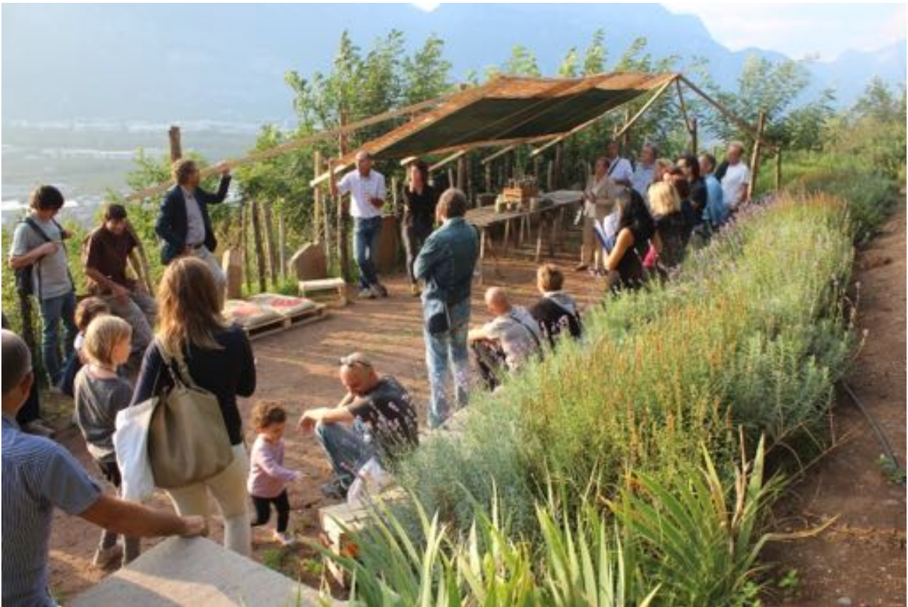
Visita all'Orto in Villa di Meano durante la Giornata del Paesaggio 2014

molto attiva, sia per quanto riguarda le manifestazioni, sia per la formazione comune. Tra gli eventi: il Festival dell'Etnografia (Museo degli Usi e Costumi della Gente Trentina-MUCGT, San Michele all'Adige), le Feste Vigiliane (Trento), la Fiera "Fa' la Cosa Giusta" (Trento) e una giornata di presentazione al MUSE – Museo delle Scienze di Trento.