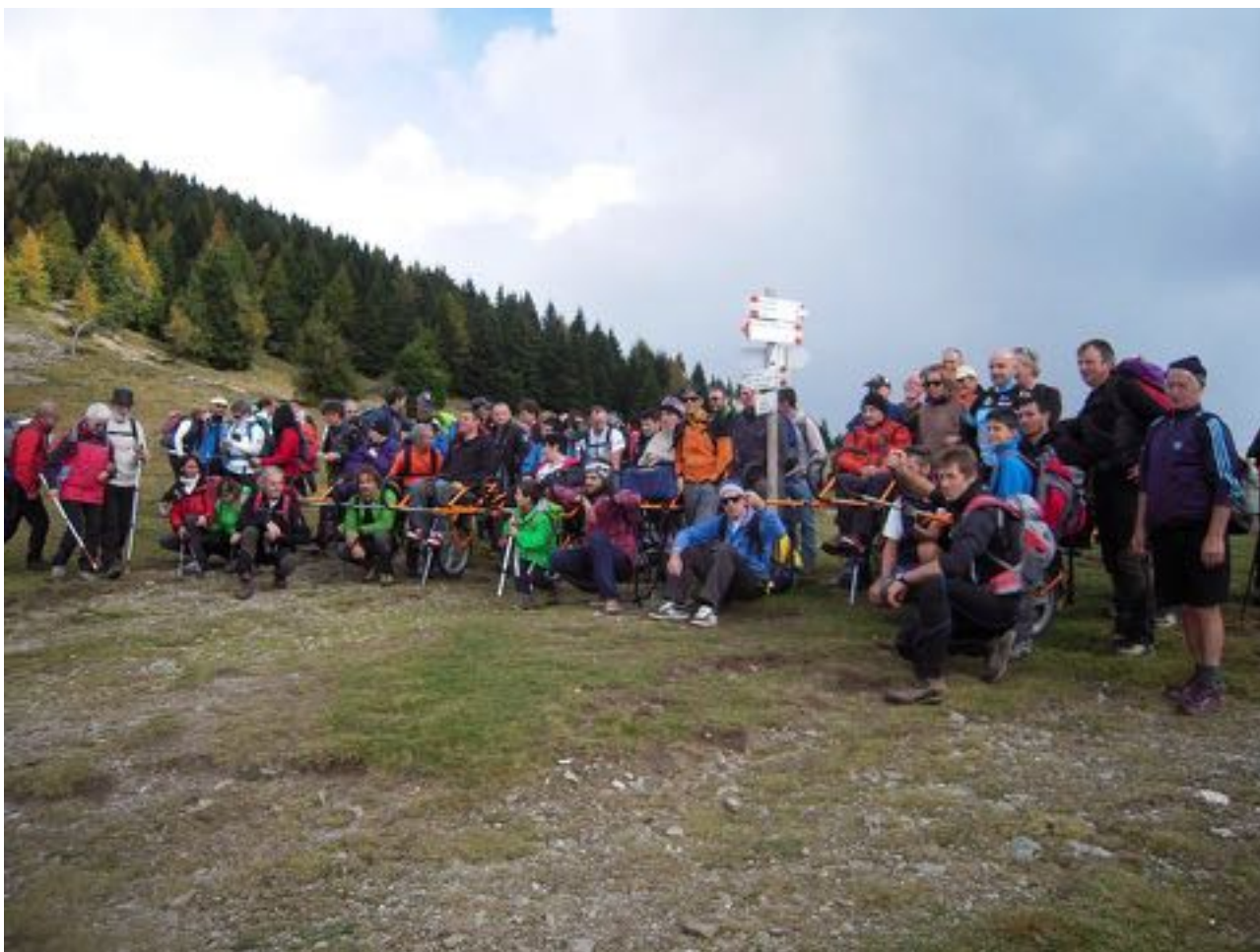
Il primo raduno delle joelettes delle sezioni SAT trentine sulla Panarotta