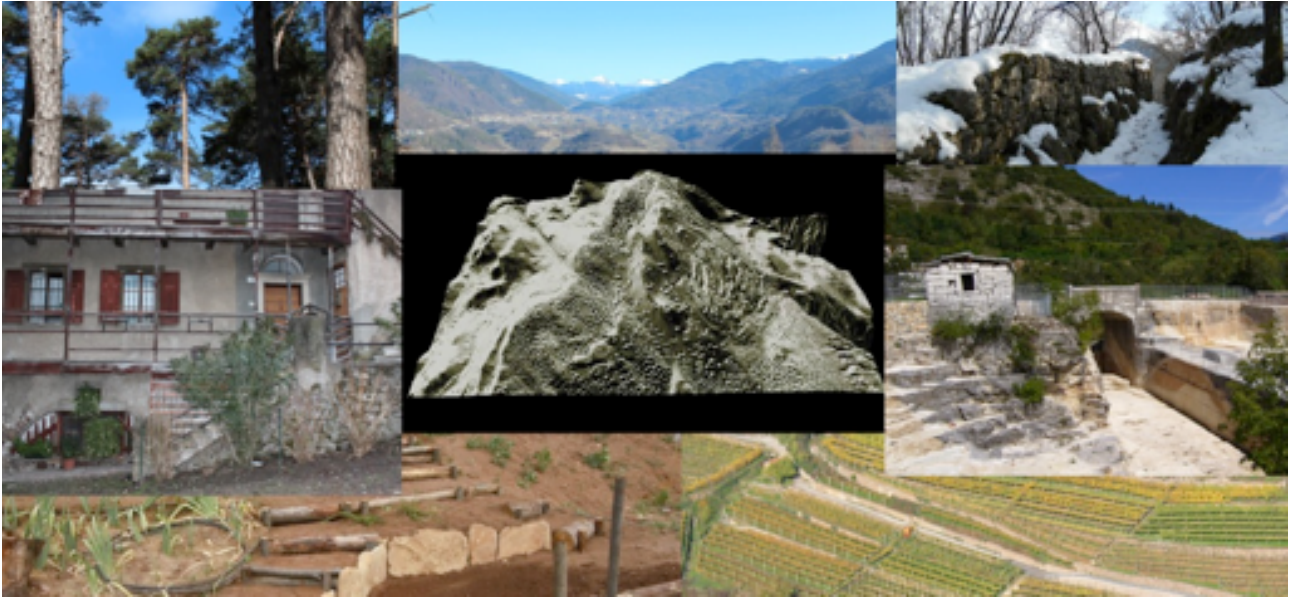
Una visione d'insieme dei paesaggi dell'Ecomuseo Argentario

Nel corso del 2015 sarà inaugurato “El sinter per le cave” un nuovo percorso tematico ad Albiano realizzato nell’ambito del progetto SOTTOSOPRA!, che porta a conoscere i diversi aspetti storici, naturalistici e culturali del paese, con un focus sul mondo delle cave di porfido.