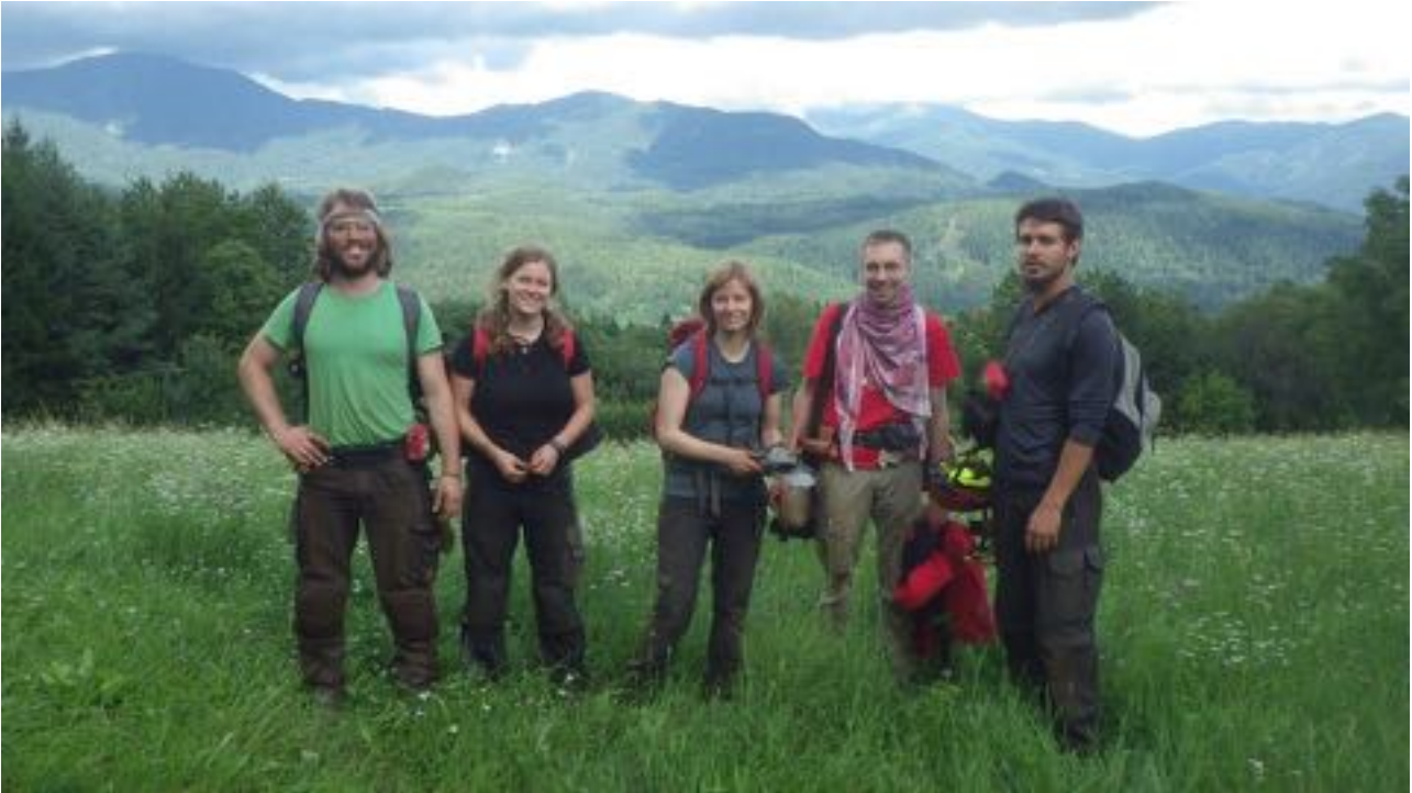
Archeologi minerari all'uscita dalla Canopa del Doss del Cuz

di scavo corrisponde al periodo in cui sono state redatte le norme minerarie del Codex Wangianus (XI-XIII secolo). Sulla superficie del Doss del Cuz sono state rinvenute le tracce di alcune strutture in muratura che potrebbero essere connesse all'attività estrattiva.