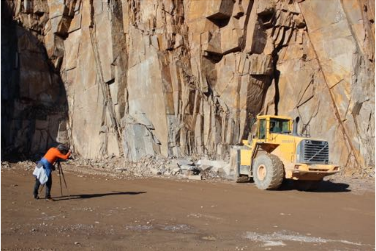
Un momento delle riprese televisive presso una cava di porfido di Albiano