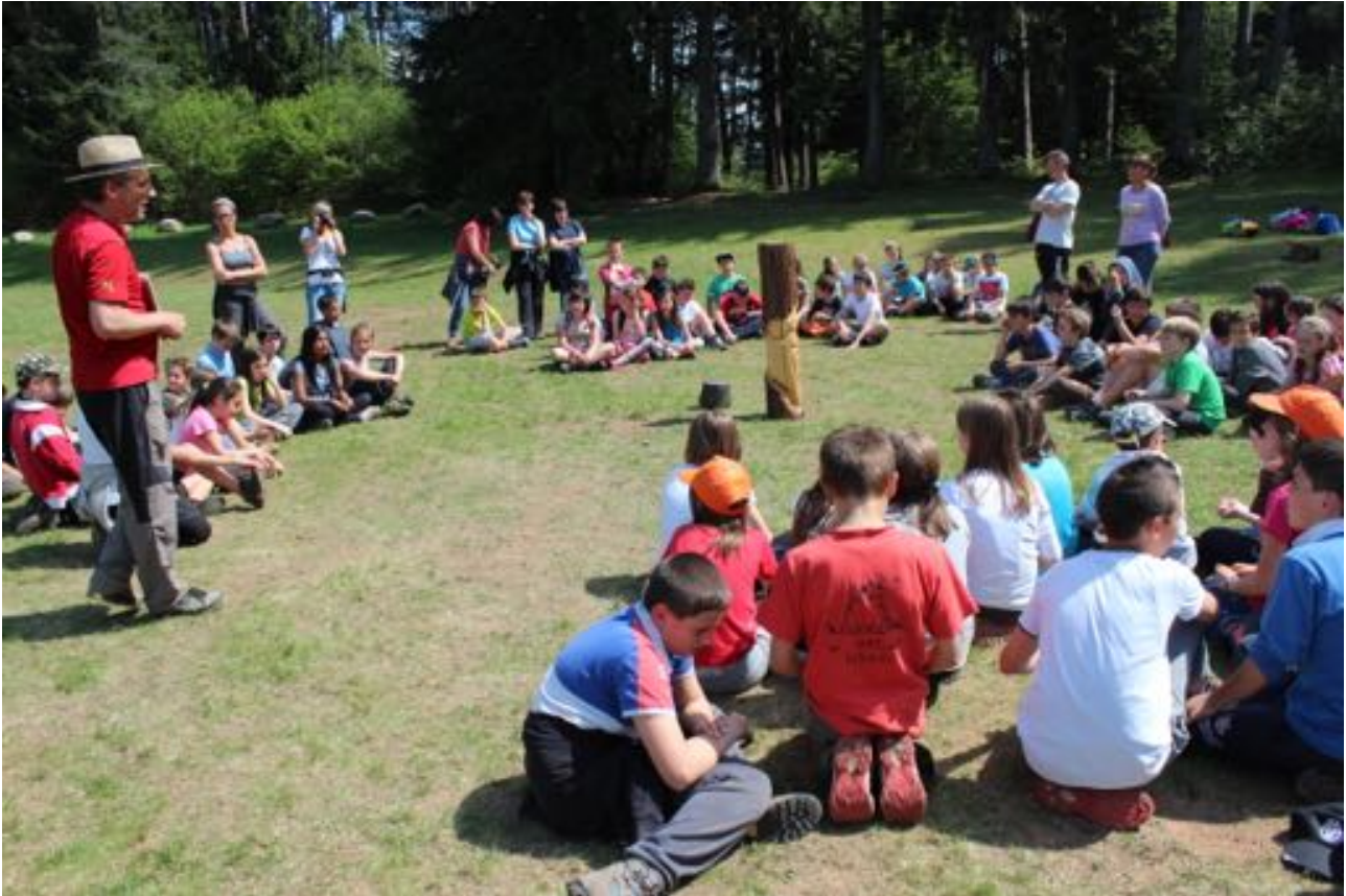
Un momento della giornata ludico-didattica "Argento Vivo" presso i prati di Monte Piano

L'Ecomuseo ha inoltre partecipato con un contributo finanziario alla realizzazione del corso sui muretti a secco organizzato dalla Pro Loco Cà Comuna di Meano.