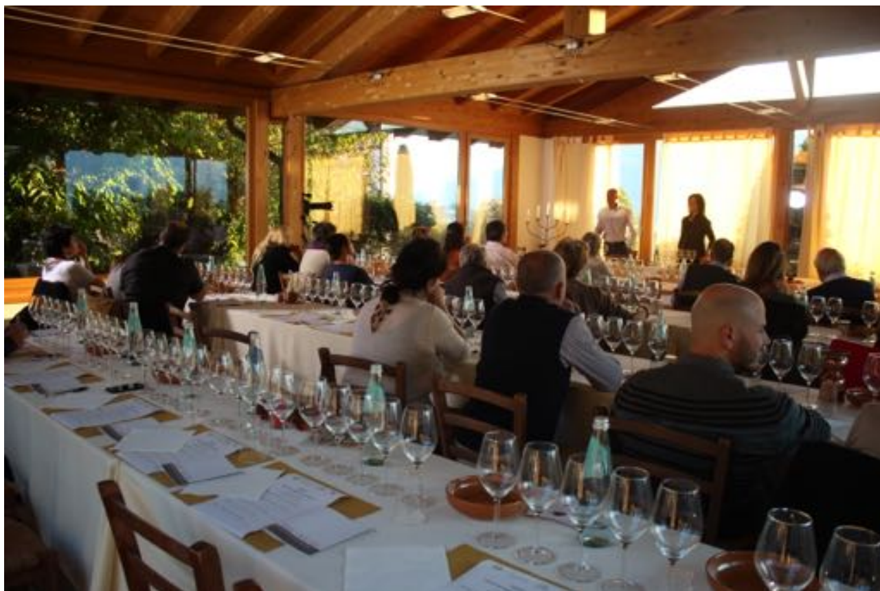
Degustazione di vini e castagne presso Maso Martis in occasione di Divin Ottobre

aziende provenienti dal territorio ecomuseale e delle aree limitrofe.